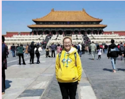
王 卉 艺术学院 15 音乐学(师范)2 班学生

该同志严于律己,理想信念坚定,刻苦学习,做好学生本职工作,发展兴趣,丰富课余时间,乐于奉献,热爱生活,追逐梦想,向上向善。 在思想上,认真学习习近平新时代中国特色社会主义思想,注重党性修养,不断以党员标准鞭策自身。在学习上目标明确,认真刻苦,积极参加学科竞赛,在业余生活中,积极参加学校社团组织活动,参与志愿服务。在工作中,兢兢业业,任劳任怨,以身作则,认真做好团支书工作,引导同学积极向党组织提交入党申请,在党支部中,能认真做好组织宣传委员的工作,积极配合支部书记工作。在生活中,乐于助人,尽自己所能帮助他人,为人正直,积极向上,自强不息,生活简朴。